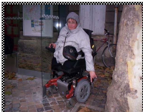
A hauteur du N° 231 de la rue Judaïque

Il est impossible de passer à cet endroit avec une poussette ou un fauteuil .