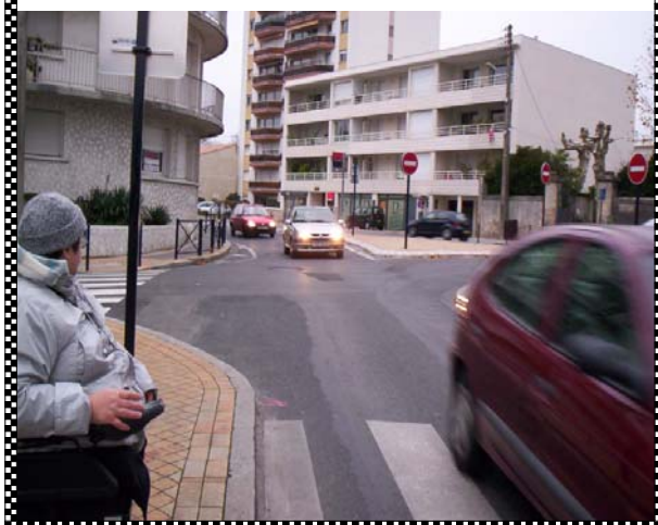
Angle rues Ch de Gaulle/Sacré Cœur/ Gd Lebrun

lorsqu'on emprunte le passage piéton en direction du Parc Bordelais, on ne peut pas voir les voitures qui roulent vite et souvent sans respecter de distance de sécurité. Un résident voisin nous a confirmé que cet endroit était très dangereux. Nous suggérons de mettre soit une signalisation lumineuse avant le carrefour, soit un miroir permettant aux piétons d'anticiper la circulation, voire même implanter un coussin berlinois pour « casser » la vitesse.